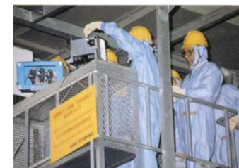
監視装置の保守管理